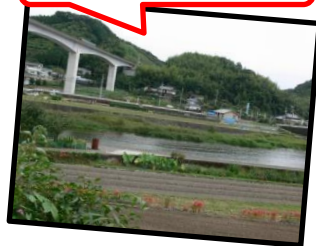
はりまや橋から 車で約15分