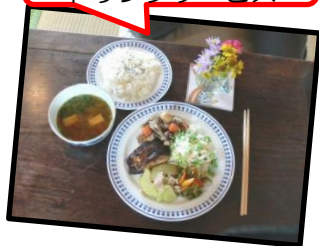
SO-AN の スペシャルランチ付