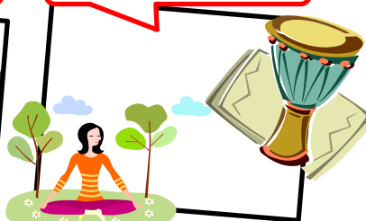
ジャンベ体験 (アフリカの太鼓) ヨガ体験コースもあります。